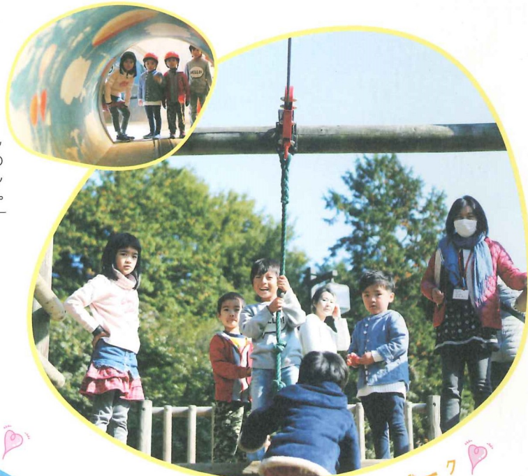
森の中にある小さなテーマパーク